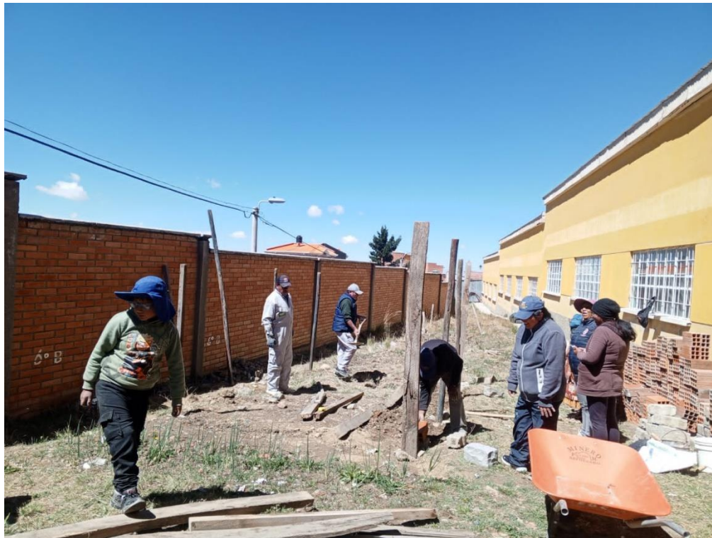
Madres y padres de familia y estudiantes en el trabajo comunitario para la construcción del huerto escolar