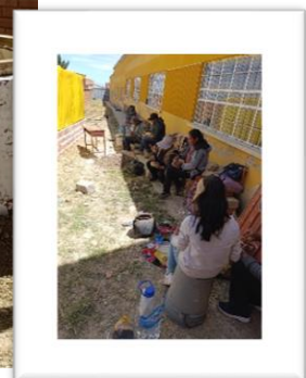
Proceso de la construcción, con la guía de un albañil