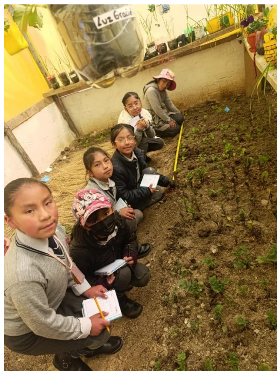
Estudiantes realizando cálculos matemáticos