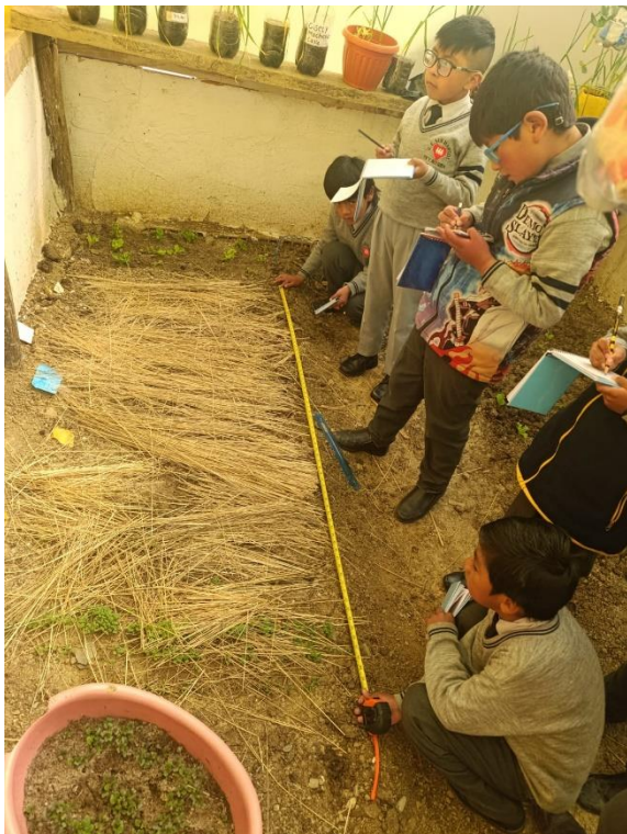
Valorando los datos de medida del almácigo