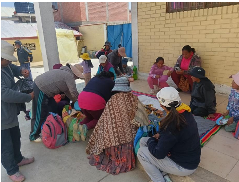
Participación activa de los estudiantes y madres, padres de familia.