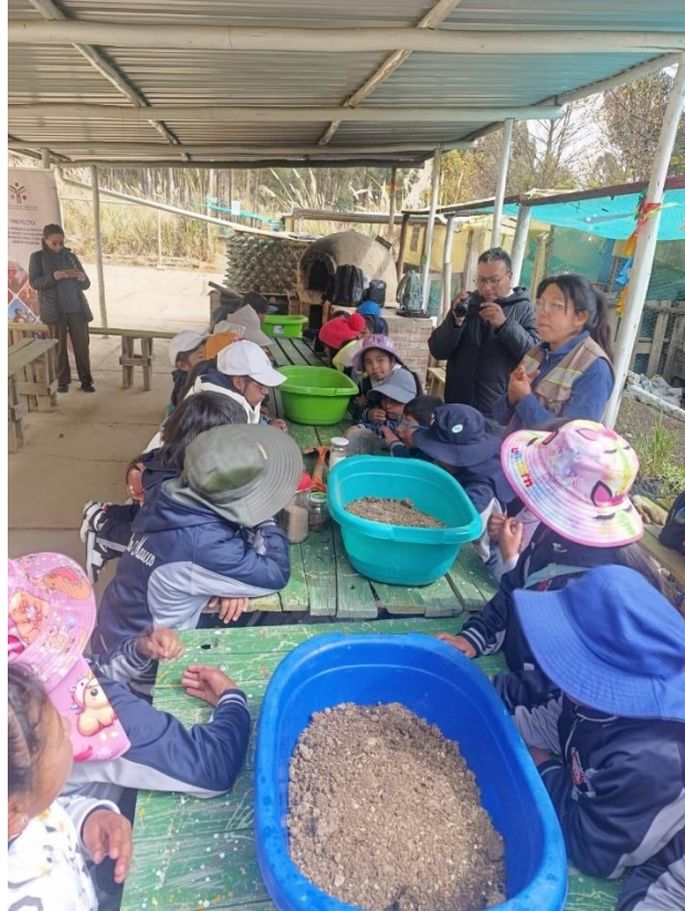
Recibiendo las orientaciones adecuadas para el almácigo de una semilla