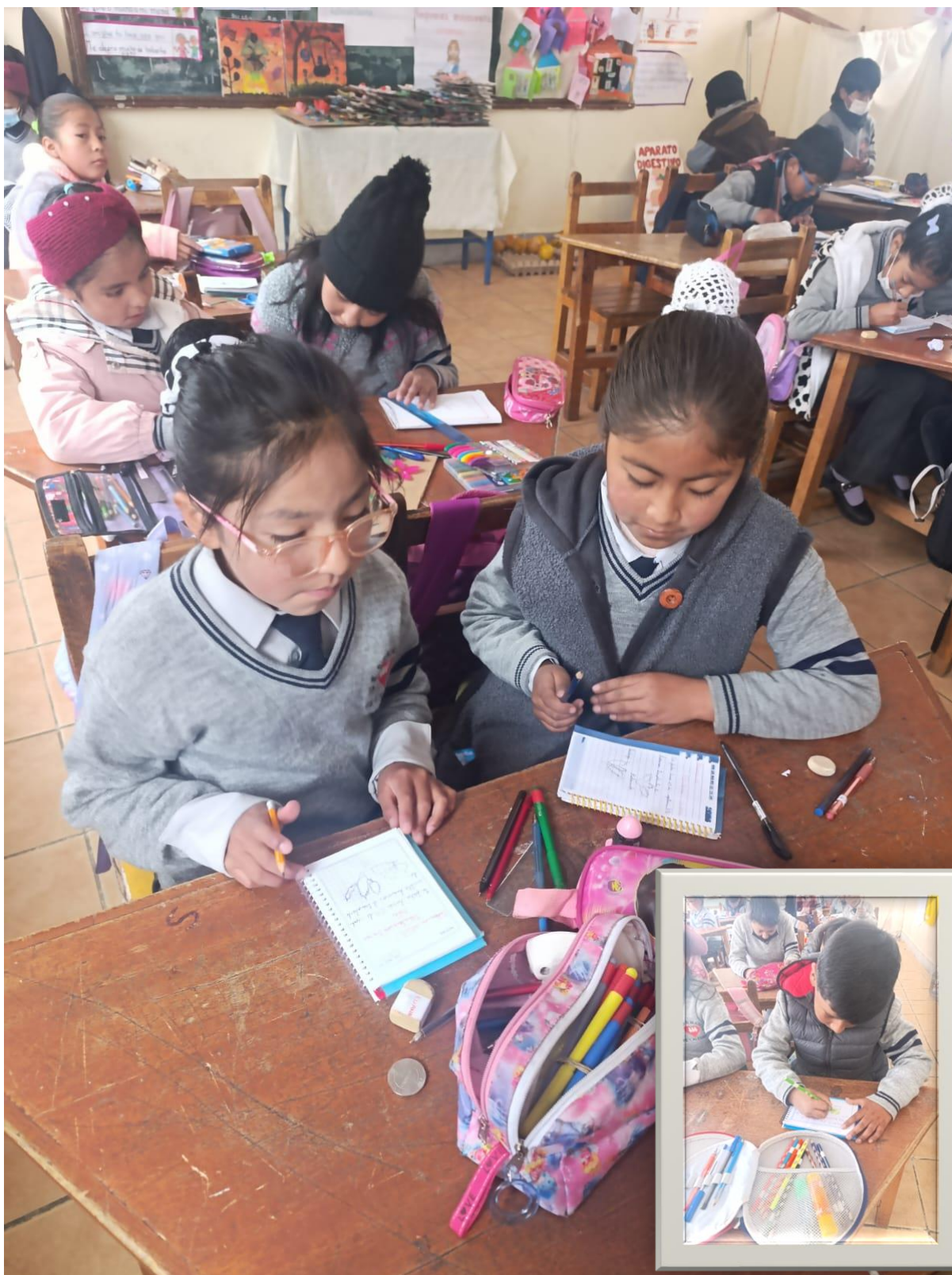
Las y los estudiantes escribiendo su producción de texto sobre las experiencias vividas en el huerto escolar