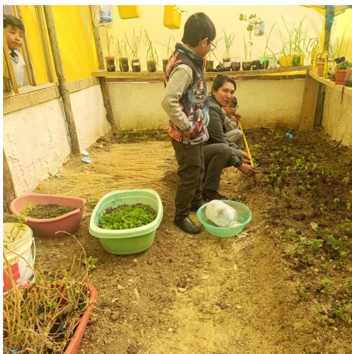
Midiendo el sembrado de beterraga