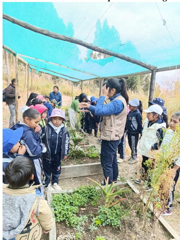
La importancia del contacto con el suelo