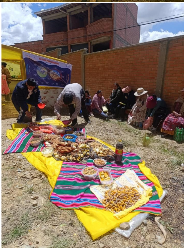
Día de la inaugura del huerto escolar “La Retama”