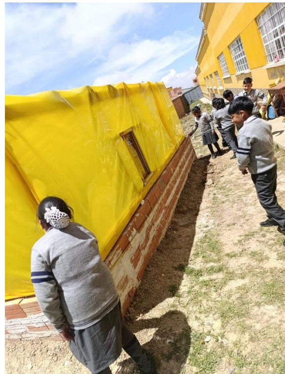
Midiendo el huerto escolar largo y ancho