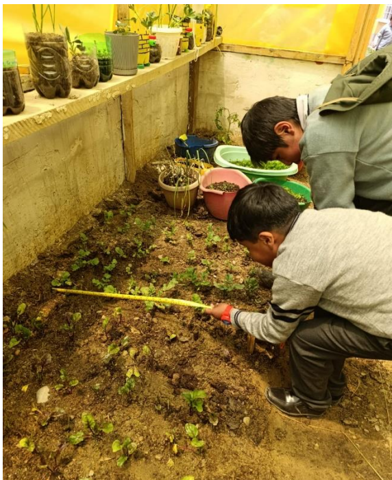
Midiendo el sembrado de rabanito