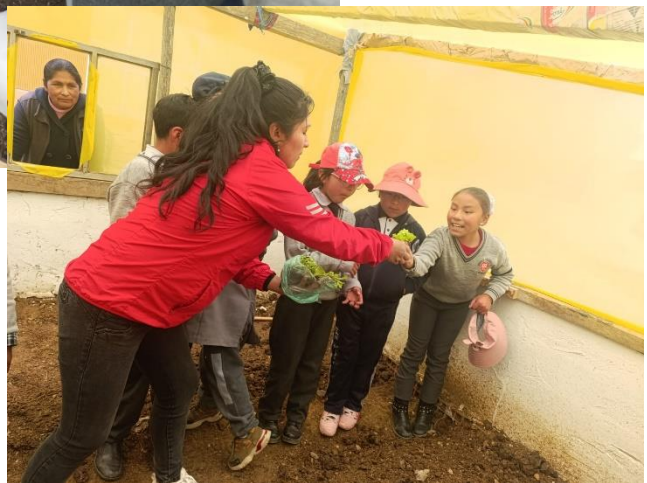
Plantación de algunas hortalizas y almácigo de semillas