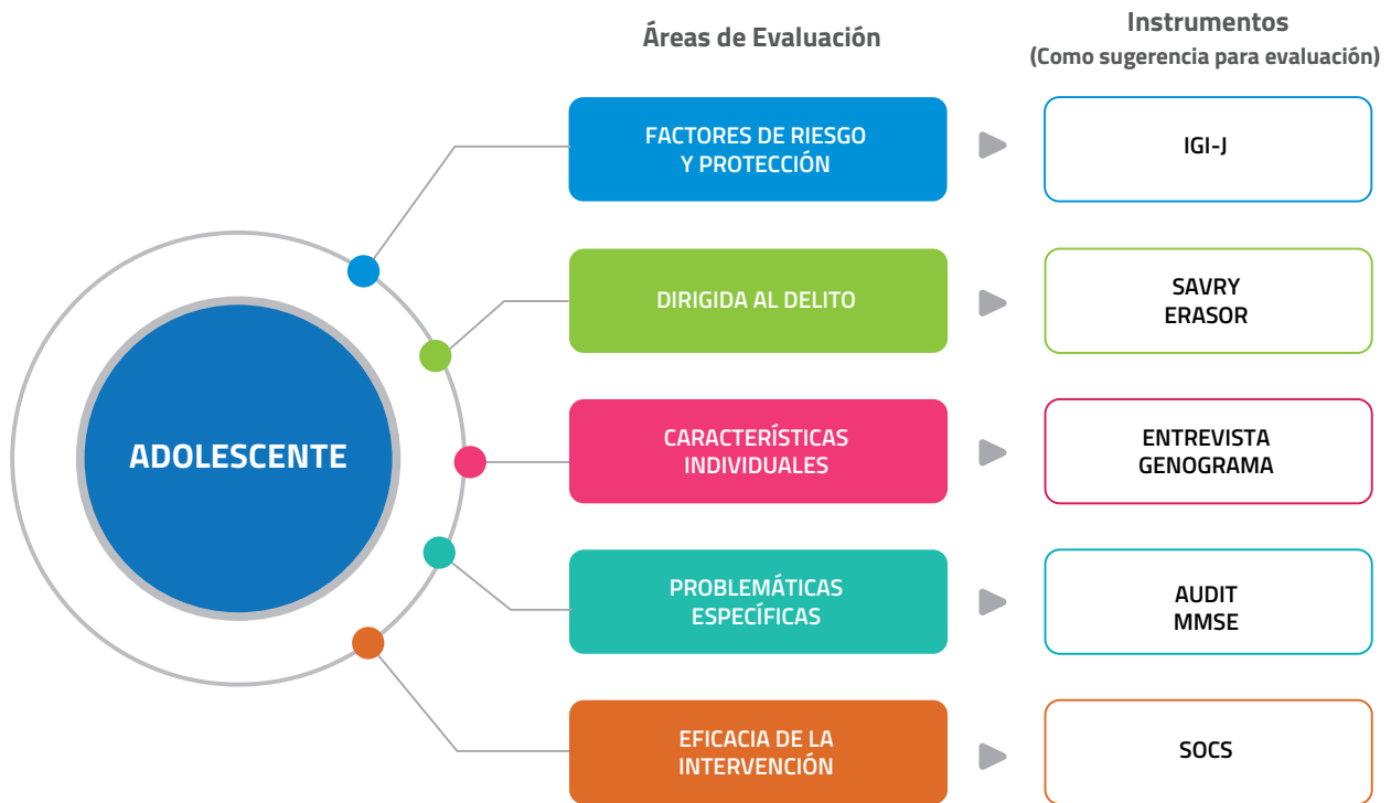
Cuadro No. 1: Áreas de evaluación e instrumentos

Los instrumentos planteados para la evaluación son sugerencias para los profesionales en el área de evaluación clínica, quienes pueden utilizar otros instrumentos siempre y cuando cubran las áreas planteadas de evaluación para lograr la evaluación especializada. Sin embargo, es fundamental incluir la evaluación de la eficacia de la intervención en el adolescente.